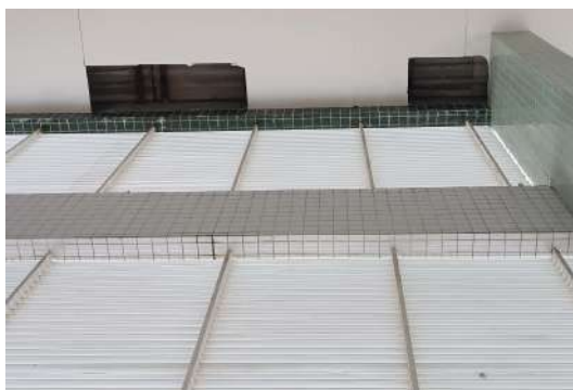
Foto 03: Placas de gesso retiradas devido ao risco de desabamento.