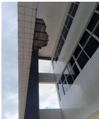
Foto 02: Descolamento e ruptura de parte do forro de gesso do bloco acadêmico.