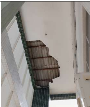
Foto 05: Descolamento e ruptura de parte do forro de gesso do bloco acadêmico.