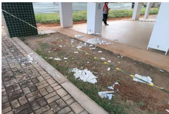
Foto 01: Área isolada por incidência de desabamento de parte do forro de gesso.